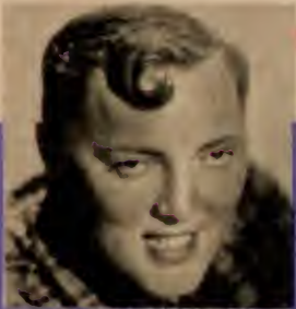
Der zweite Bill-Haley-Film schon da! (S. 36)

Nr. 1 · 6. Januar 1957 · 50 Pfennig · Postverlagsort München